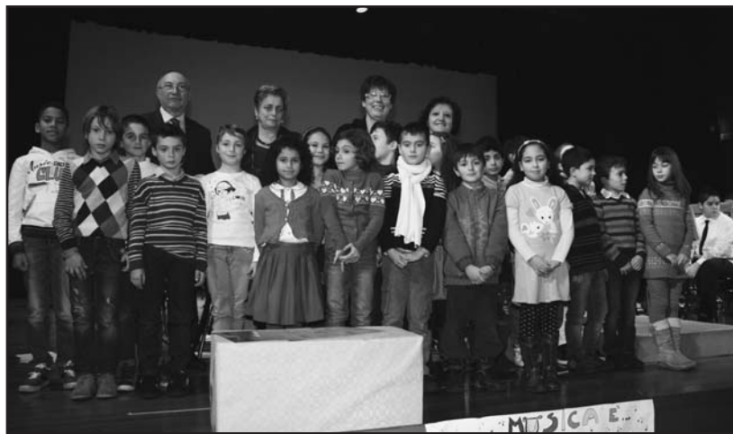
Le classi 3 A e B di Borgosotto e le maestre premiate dal Presidente Badalotti.

Quest'anno la direzione della banda ha voluto indire un concorso fra le scuole elementari sul tema: UN GIORNO IN BANDA. Sono risultate vincitrici le terze elementari A -B della scuola di Borgosotto con un originale filmato-sonoro dove i ragazzi rappresentavano e descrivevano i vari strumenti musicali. I ragazzi sono saliti sul palco con le maestre ed hanno cantato una inedita canzone di auguri per le prossime festività.