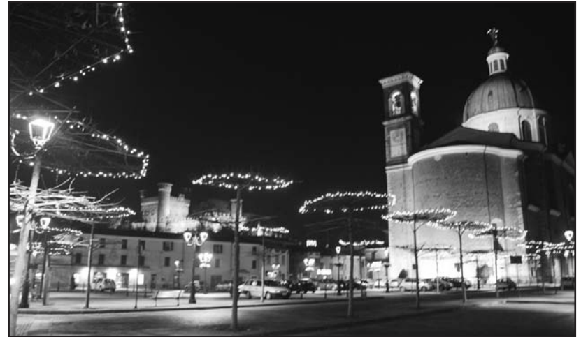
Luminarie a Montichiari.

PER SPEDIRE MESSAGGI info@ecodellabassa.it tel. 335 6551349