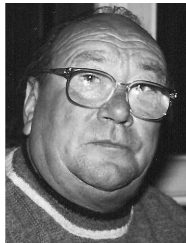
Sebastiano Zaltieri 2° anniversario