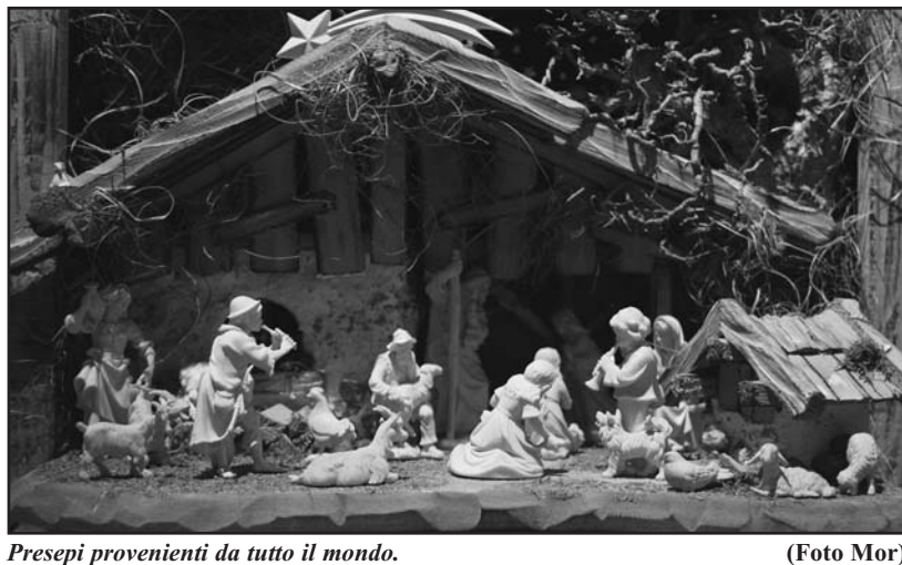
Presepi provenienti da tutto il mondo.

Undicesima edizione corsi teorico-pratici